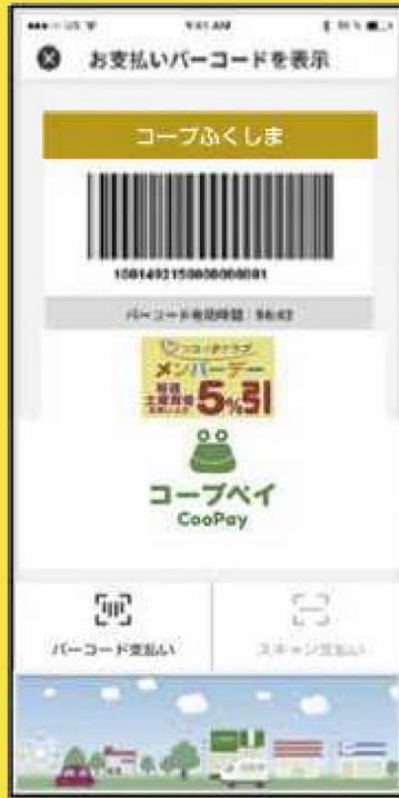
コープペイバーコード画面