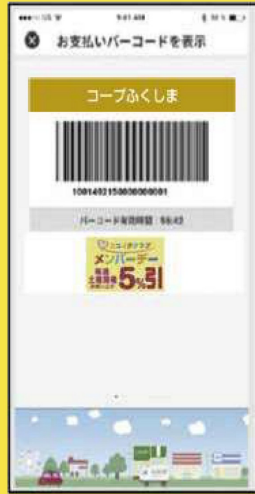
現金・その他バーコード画面