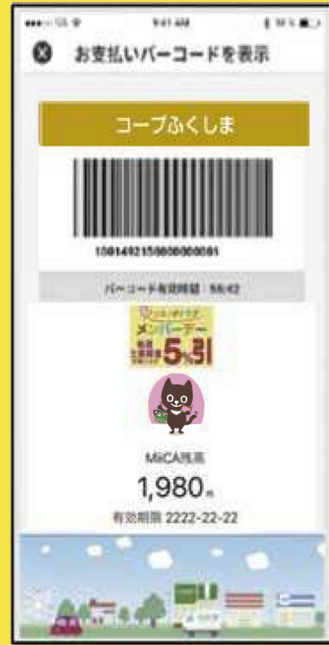
MiiCAカードバーコード画面