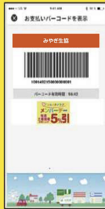
現金・その他バーコード画面