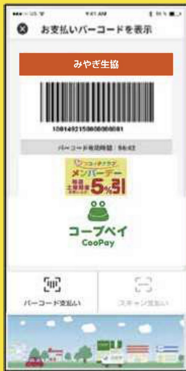
コープペイバーコード画面