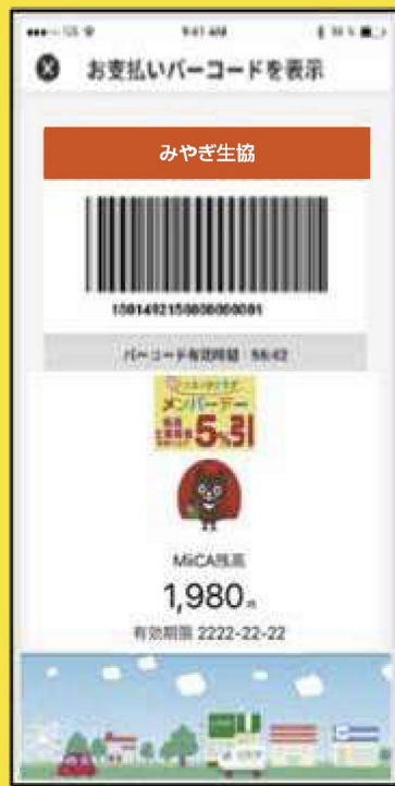
MiiCAカードバーコード画面